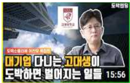
대기업 다니던 명문대생이 도박하면 벌어지는 일들