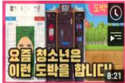
아이들은 어쩌다 도박에 빠지게 된 걸까?